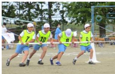
心を合わせて！「台風の子 4年生」