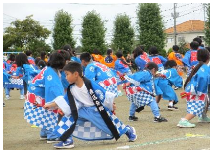
踊る・舞う・跳ねる「よっちょれ 全校」