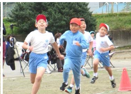
全力で走る 「徒競走 3年生」