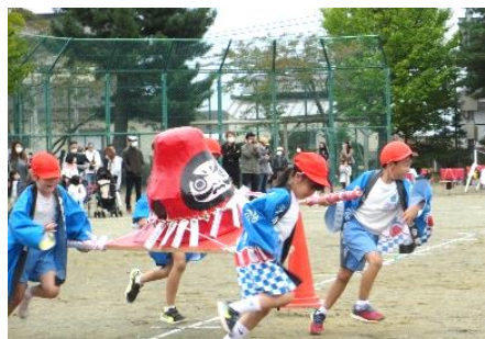
急げ！急げ！「ダルマでワッショイ」2年生