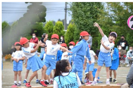
ハイ！ポーズ「ダルマでワッショイ」1年生

子供たちの全力で取り組むパワーと保護者の皆様の熱い声援で、コロナ禍の運動会が無事開催できました。