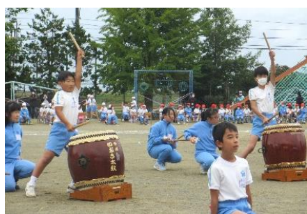
堂々と 「ぶち合わせ太鼓 5年生」